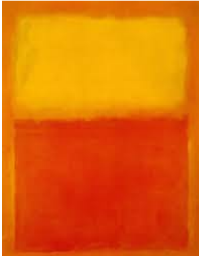
Mark Rothko Orange and Yellow

Das Wohl des Kindes ist ein zentrales pädagogisches Anliegen, das auch im Falle der Tagesschule leitend ist.