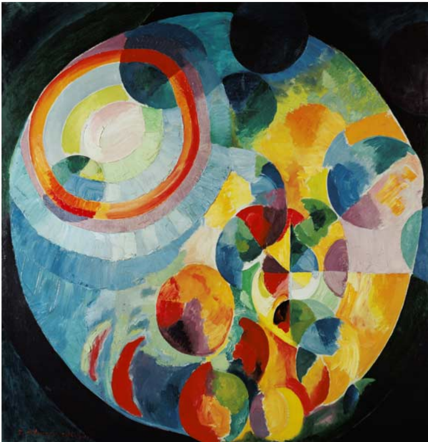
Robert Delaunay le soleil et la lune

Die Tagesschule mit einem Anspruch an Ganzheitlichkeit muss sich als offene und gestaltete Schule im öffentlichen Raum bzw. Sozialraum verstehen.