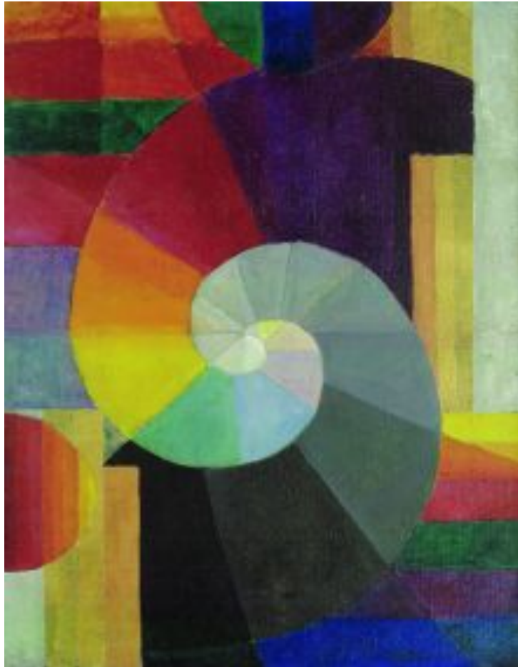
Johannes Itten Begegnung

«Die Menschen stärken und die Sachen klären»