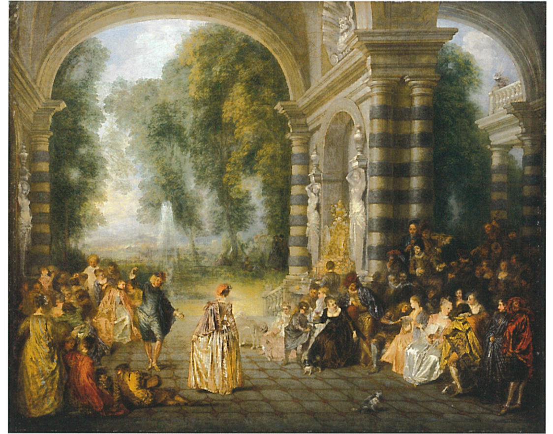
Abb. 1 Antoine Watteau, Les Plaisirs du Bal , um 1715–17. Öl/Lw., 52,5 x 65,2 cm. London, Dulwich Picture Gallery (Ausst.kat. De Watteau à Fragonard. Les fêtes galantes , hg. v. Christoph M. Vogtherr/Mary T. Holmes, Brüssel 2014, Kat.nr. 7)

Erwähnenswert wäre in diesem Zusammenhang allerdings auch die im 18. Jahrhundert fortschreitende soziale Integration der Mathematik gewesen, die alledem Vorschub leistete – zumal dieser wichtige Aspekt im Tagungsverlauf unterbelichtet blieb. So hatte vor allem Voltaire durch seine naturwissenschaftlichen Debatten mit Émilie du Châtelet, die eigenen physikalischen Versuche auf Schloss Cirey sowie die Edition eines po-