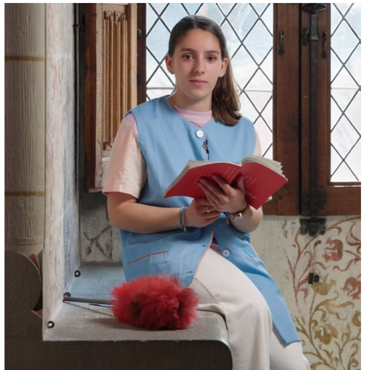
Article 110 Travail