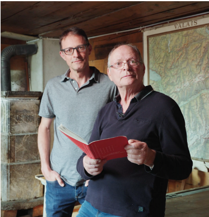
Article 5 Principes de l'activité de l'État régi par le droit