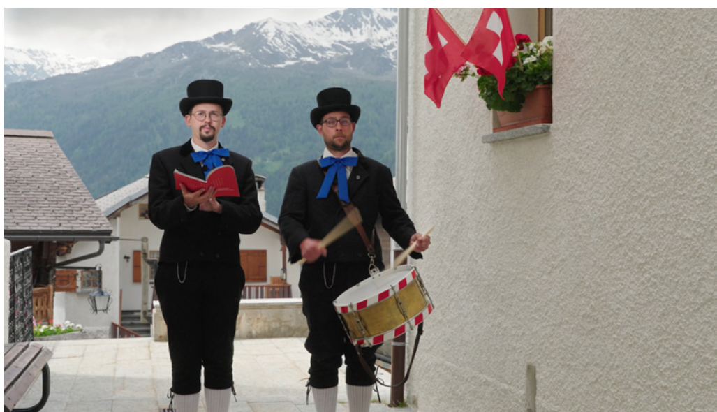
Article 53 Existence, statut et territoire des cantons