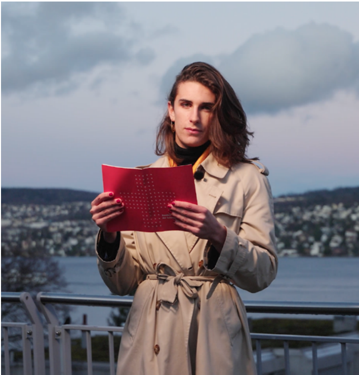
Artikel 20 Wissenschaftsfreiheit