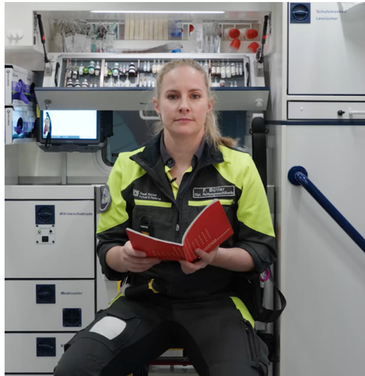
Artikel 118 Schutz der Gesundheit