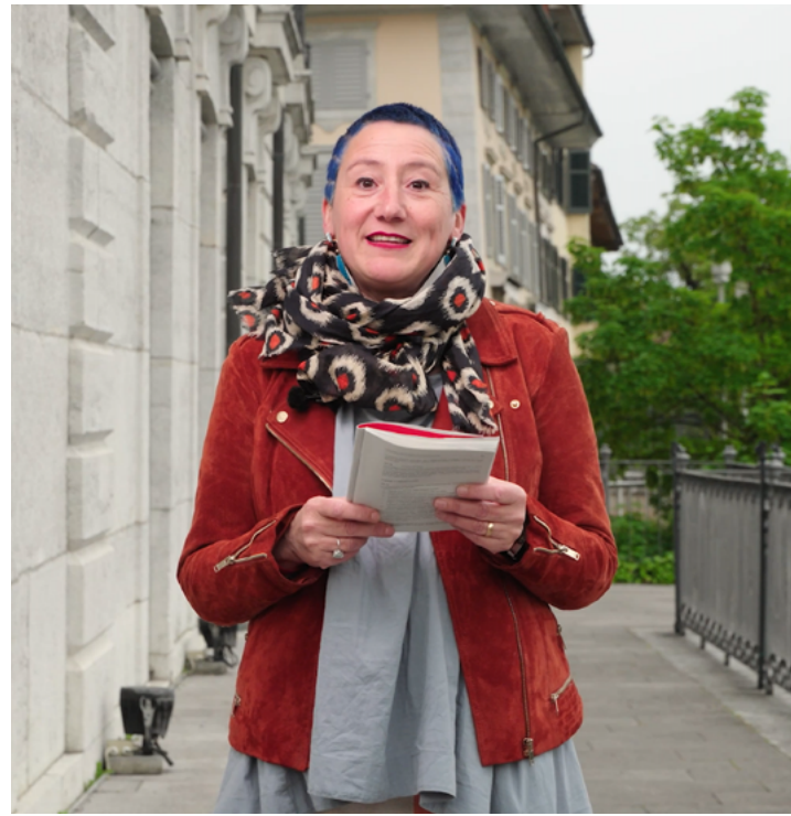
Articolo 38 Acquisizione e perdita della cittadinanza