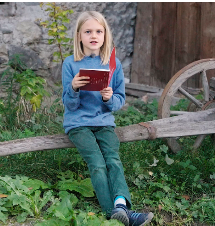
Artitgel 7 Dignitad umana