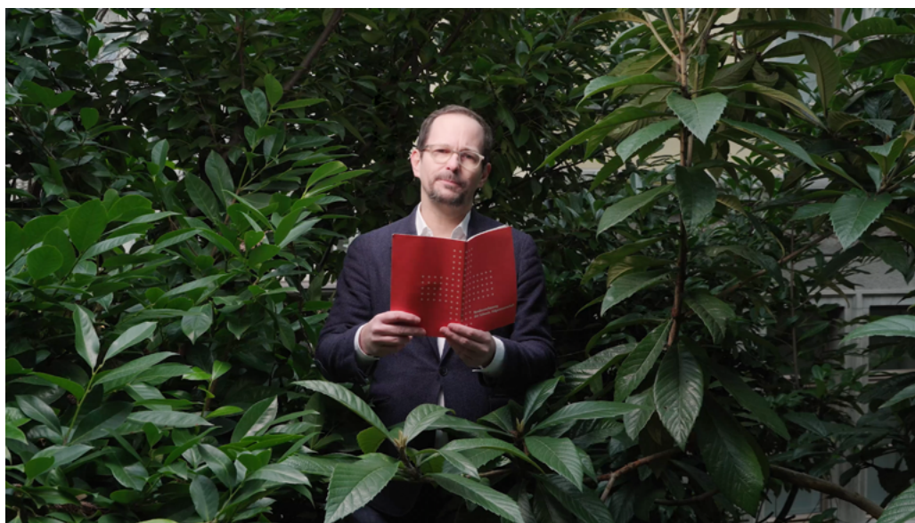
Artikel 74 Umweltschutz