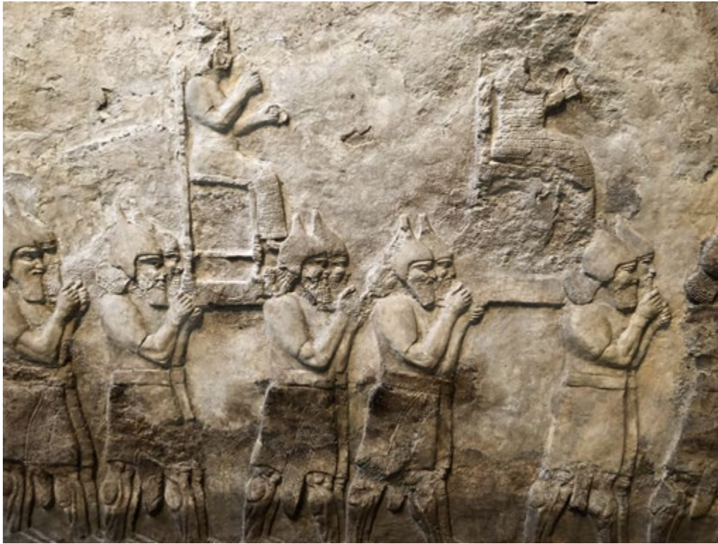
Abbildung 5: Die Darstellung der Deportation von zwei Götterbildern durch assyrische Soldaten. Relief aus dem Palast Tiglath-Pileasers III. (745–727 v. Chr.) in Kalchu (Nimrud). British Museum.

assyrischer Paläste. Ungewöhnlich und ausgesprochen selten jedoch ist die bildliche Wiedergabe der Zerstörung einer Götterstatue. Schon der Akt selbst entsprach eher nicht dem üblichen Verfahren: Nach der Eroberung einer feindlichen Stadt entführte man in aller Regel die Götterbilder aus den Tempeln und brachte sie unversehrt nach Assyrien, wo sie einen Platz in einem der Heiligtümer Assurs, Kalchus, Arbils oder Ninives fanden ( Abbildung 5 ).