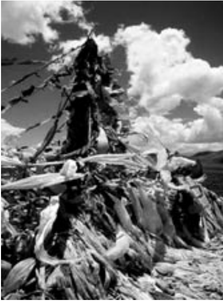
Gebetsfahnen im Himalayagebiet. Religiöse Symbole auf dem Dach der Welt.