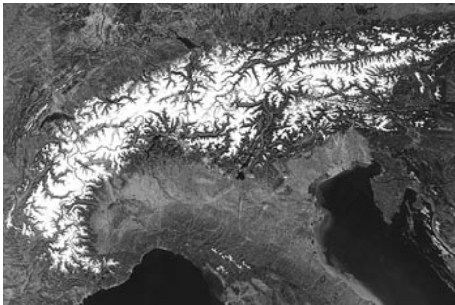
Die Alpen – verschiedenste Lebensräume und Landschaften, die es zu erforschen und zu verstehen gibt.