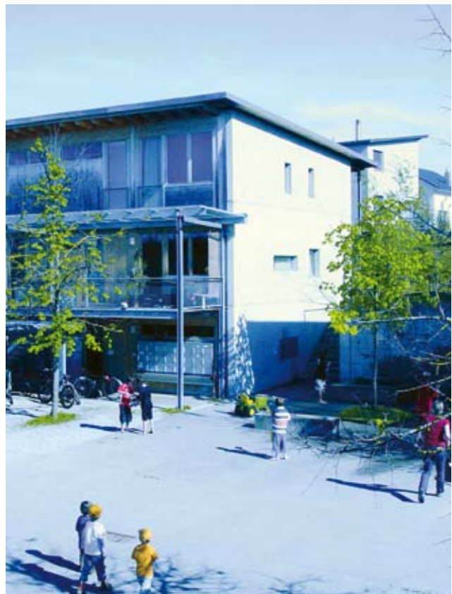
Verdichtete Bauweise mit Platz für Begegnungen wirken der Zersiedelung entgegen.

Schliesslich sind auch die Monitoring- und Evaluationsprozesse zu stärken, um eine effiziente Raumnutzung sicherzustellen. Auf Bundesebene sind im Bereich der Umsetzung des Gesetzes zudem griffigere Instrumente vorzusehen.