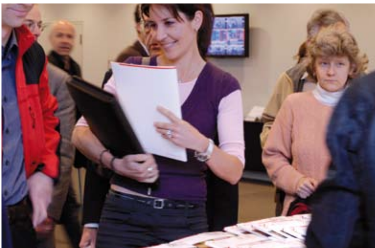
Die Veranstaltung vom 23. April «Wissenschaftskommunikation – Chancen und Grenzen» in Zürich stiess auf reges Interesse, S. 16.