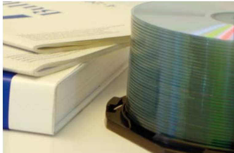
Forschungsinfrastrukturen in den Geistes- und Sozialwissenschaften: Das Thema wird an der diesjährigen Präsidentenkonferenz diskutiert, S. 23.