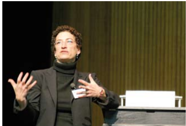
Naomi Oreskes from the University of California dealt with the question whether consensus was the goal of science.

Markus Fischer from the University of Bern focused on the feedback effects between climate, land use and biodiversity. He considers biodiversity not just as a response variable reacting to land use and climate but rather suggests that declining biodiversity is also the cause of many changes of ecosystem processes. Accordingly, political and economic decisions aiming at sustainable and climate-neutral land use need to take the role of biodiversity into account.