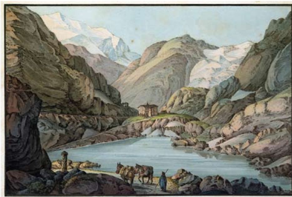
Un voyageur et deux mules chargées s'approchant de la borne qui marque la limite entre l'état de Sardaigne et le Valais. Au centre, l'hospice du Grand-Saint-Bernard avec son lac, entourée par les crêtes du Barasson et le Mont Vélan enneigé.

Plusieurs communications étaient consacrées à l'histoire des voyages dans les Alpes et à l'illustration de ces voyages. Elles ont montré comment l'histoire des voyages est liée à l'élaboration des savoirs à travers