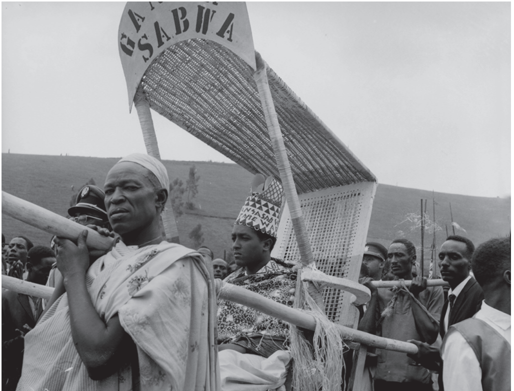
Krönungsfeier für Ntare V. 1. September 1966.

http://www.afriqueinvisu.org/images/stories/PDF/DokumentationPdP_CCF.pdf Bibliographische Angaben: Jürg Schneider: La présence du passé. Une histoire de la Photographie au Burundi, 1959-2005, Centre Culturel Français : Bujumbura 2008.