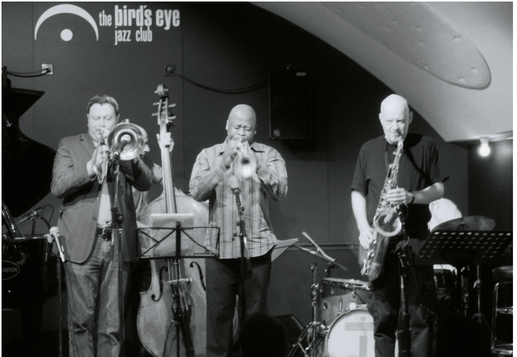
The Swiss South African Jazz Quintet ist eines der von Pro Helvetia Cape Town geförderten Projekte und trat am 12. und 13. September im bird's eye jazz club auf.