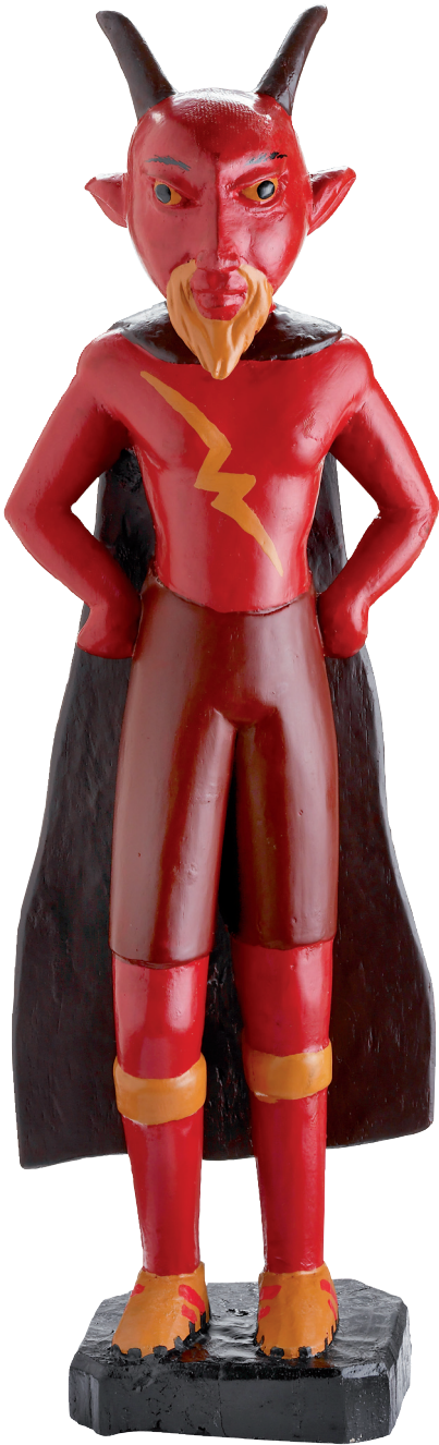
Le joueur diabolique