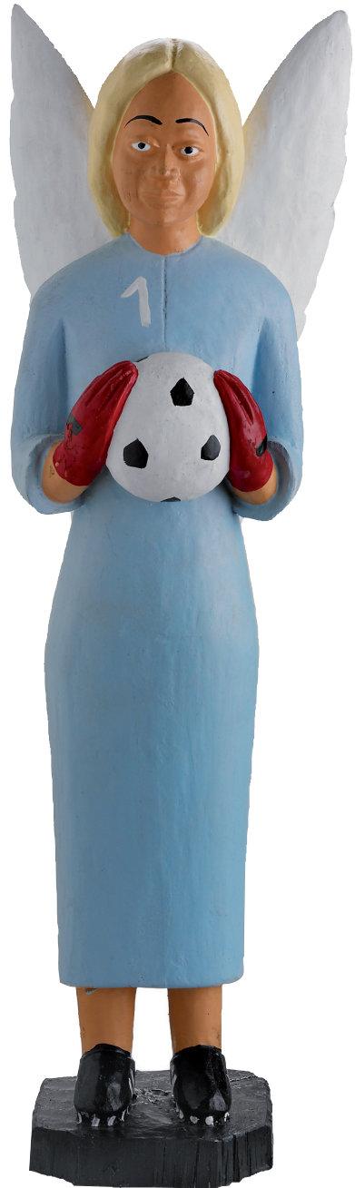
L'ange gardien © Johnathan Watts, MEG, 2008