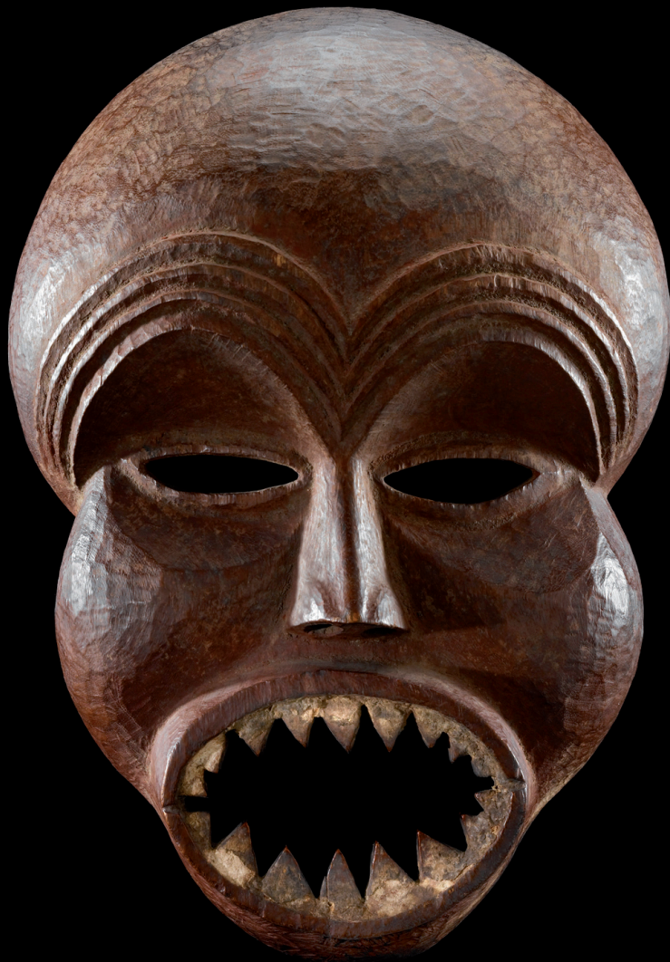
Masque initiatique / sachihongo. Mbunda. Zambia, Western Province. Avant 1930. Bois. Acquisition : Vente des Missions (Suisse), 1942. Inv. ETHAF 018740