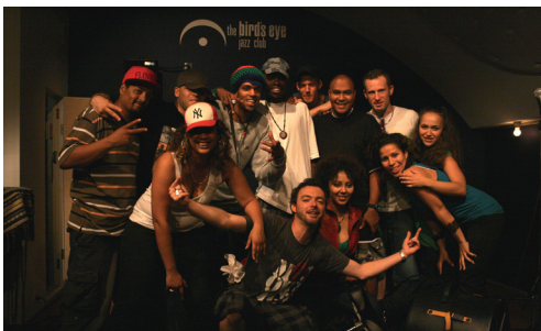
Das schweizerisch-südafrikanische Hip Hop Projekt "The Rogue State Alliance", the bird's eye 2008

Seit 1998 betreibt die Schweizer Kultur Stiftung Pro Helvetia ein Verbindungsbüro in Kapstadt als eine von zwei Vertretungen auf dem afrikanischen Kontinent (neben Kairo). Pro Helvetia Kapstadt ist im ganzen südlichen Afrika aktiv und fördert den kulturellen Austausch zwischen der Schweiz und Südafrika, Mozambique, Zimbabwe, Botswana, Zambia, Namibia und Angola, aber auch zwischen diesen afrikanischen Staaten. Das Verbindungsbüro arbeitet eng mit dem Büro der Direktion für Entwicklung und Zusammenarbeit in Pretoria zusammen. Musik und insbesondere Hip Hop und Jazz sind eine wichtige Komponente dieser Aktivitäten. Zahlreiche Projekte wurden realisiert, viele von ihnen mit lang anhaltender Wirkung. Zwei Beispiele waren im Rahmen der Tagung zu hören: das Swiss South African Jazz Quintet und die Hip Hop Formation The Rogue State Alliance.