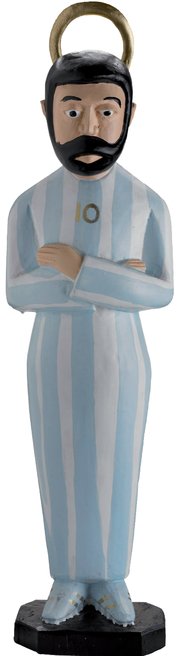
Le Dieu Maradona